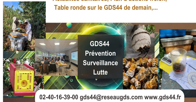
Table ronde sur le GDS44 de demain,...

Actualités sanitaires, Plan d'actions frelon,